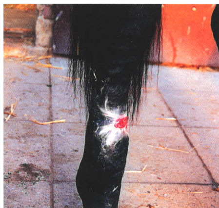
Abb. 2: Abheilung nach 4 Wochen bei fortgeführter Flächentherapie (2-mal/Woche)