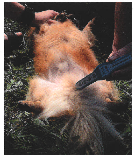
Abb.: Behandlung einer Kastrationsnarbe mit einem Punktlaser

meist durch Unterbrechungen der notwendigen Gefäßversorgung verursacht. Der Wundrand ist wulstig, starr und „eingezogen“, bricht schnell und infiziert sich erneut. Hier müssen zunächst die Wundränder und Hypergranulationsgewebe abgetragen werden, bevor der Laser eingesetzt werden kann. Er stärkt die Versorgung des Gewebes, fördert die Neubildung von Gefäßen und beugt Entzündungen vor. Bestrahlen Sie täglich und vermessen Sie alte Wunden, um den Heilungsverlauf zu dokumentieren! Häufig sind nach den ersten 10 Tagen erste Erfolge mess- und sichtbar.