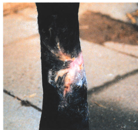
Abb. 3: Abheilung nach 4 Monaten bei fortgeführter Flächentherapie (1-mal/Woche)